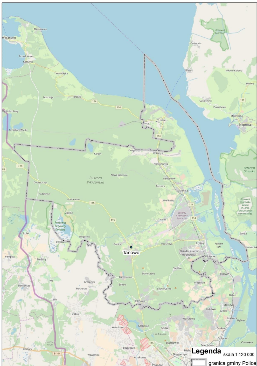
Mapa 1. Położenie miejscowości Tanowo. Opracowanie własne.